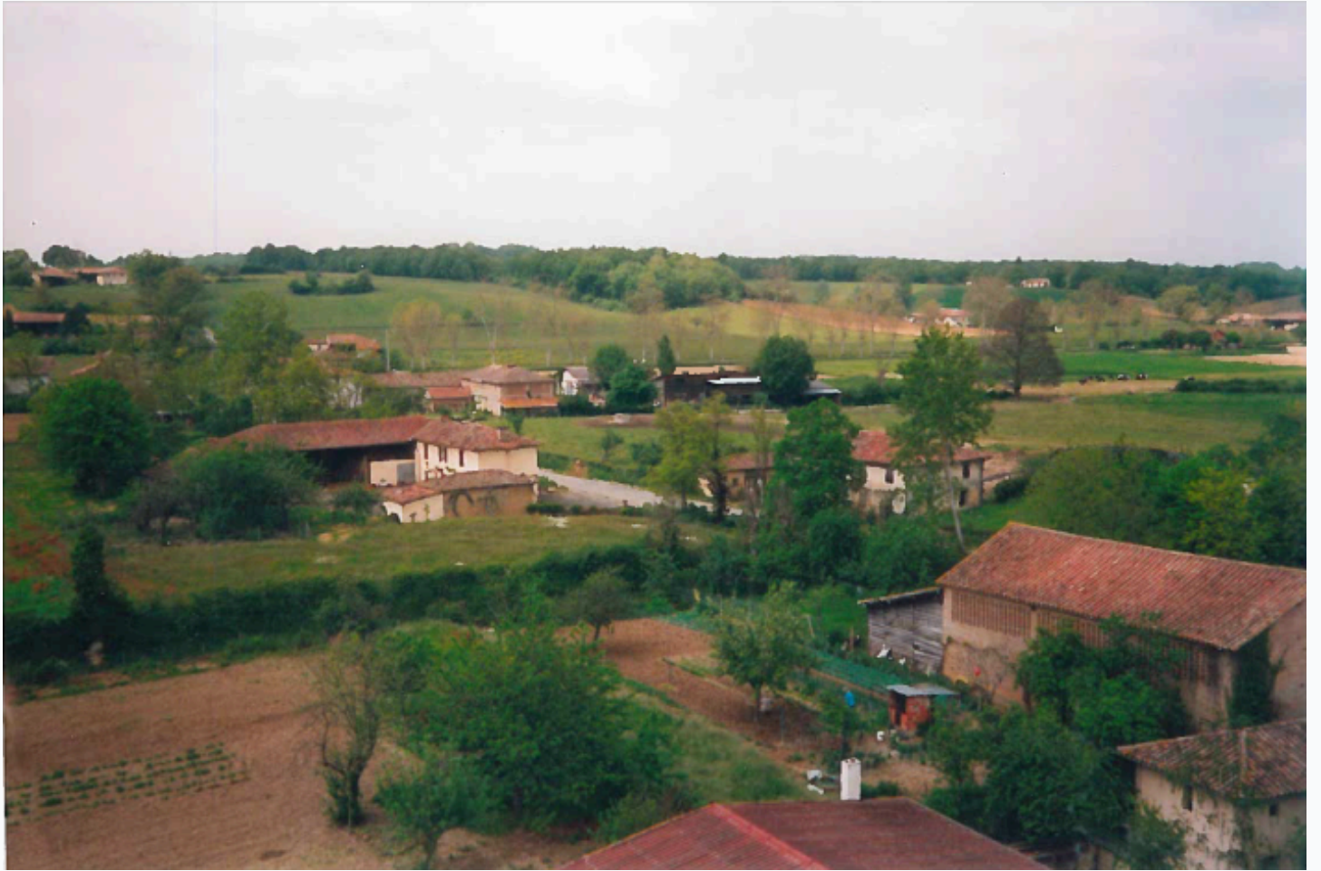
Ancienne grange Presbytère