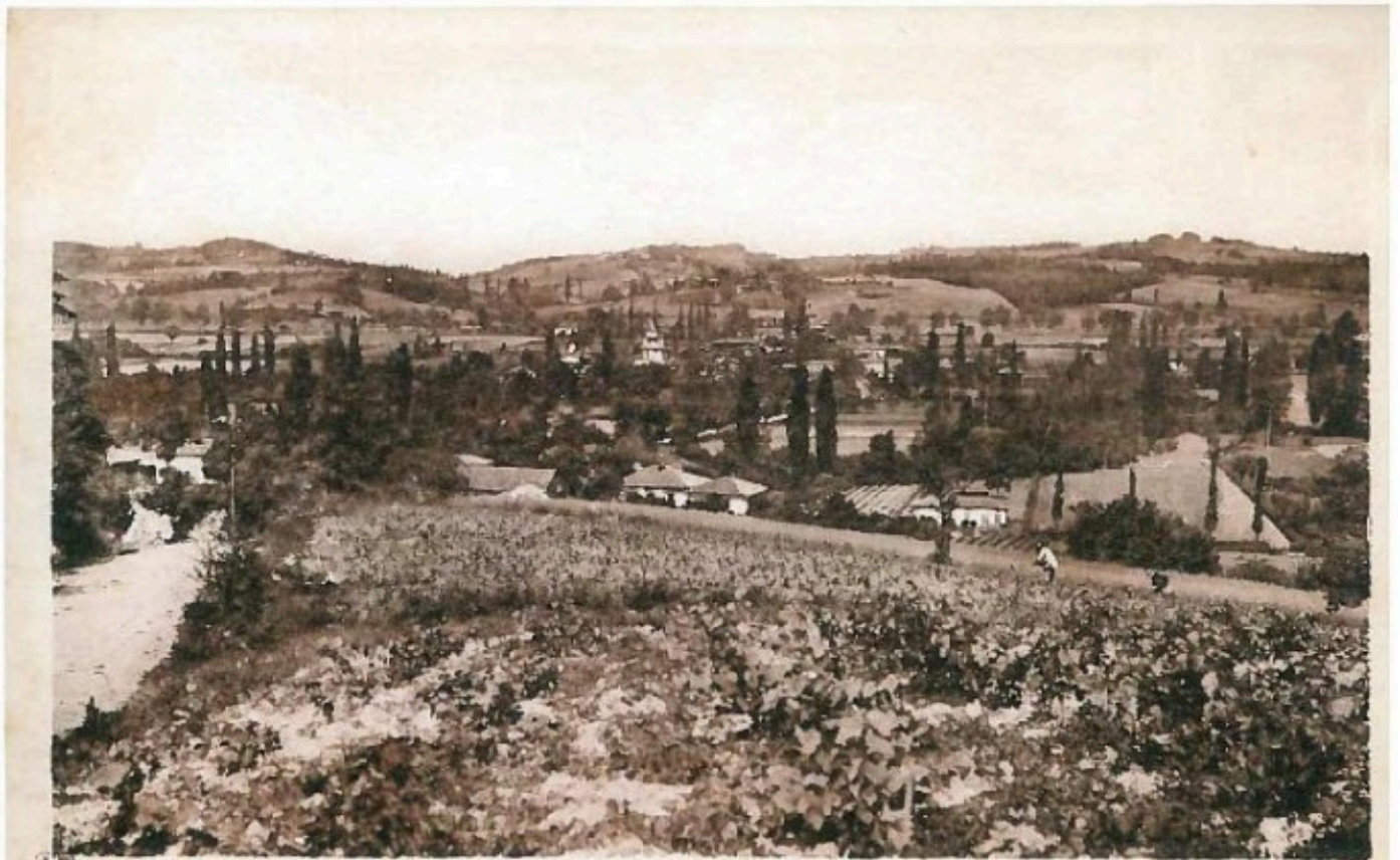
ANAN, par Isle-en-Dodon (Haute-Garonne) Vue du Village depuis la route de St FRAJOU