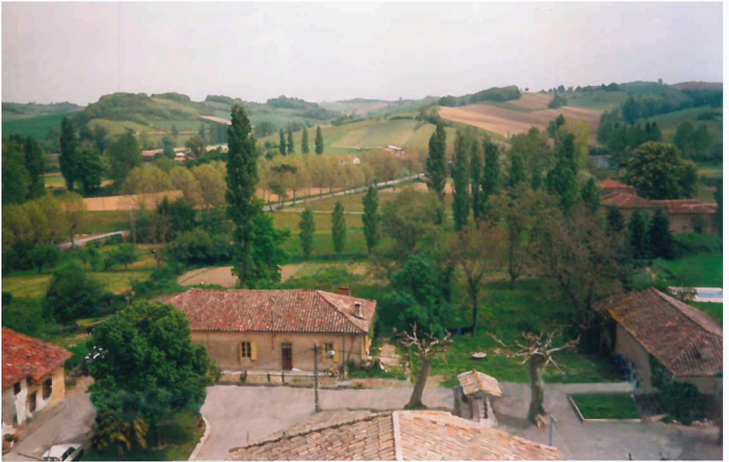
Chez Margot (Mairie actuelle) Vu de l'Église