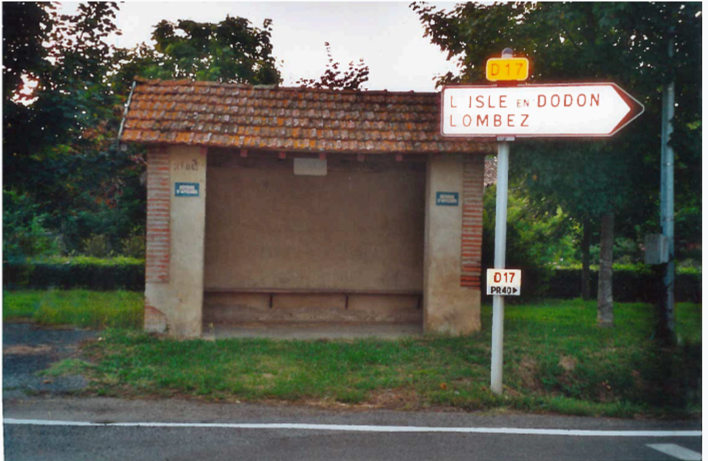
Ancienne arrêt de voie ferré (carrefour D17)