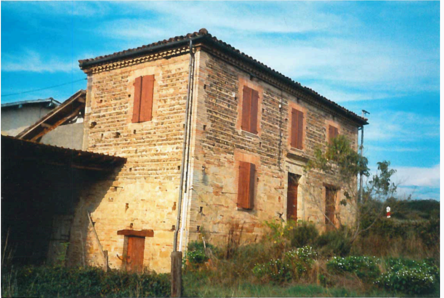
Ancienne maison du tailleur