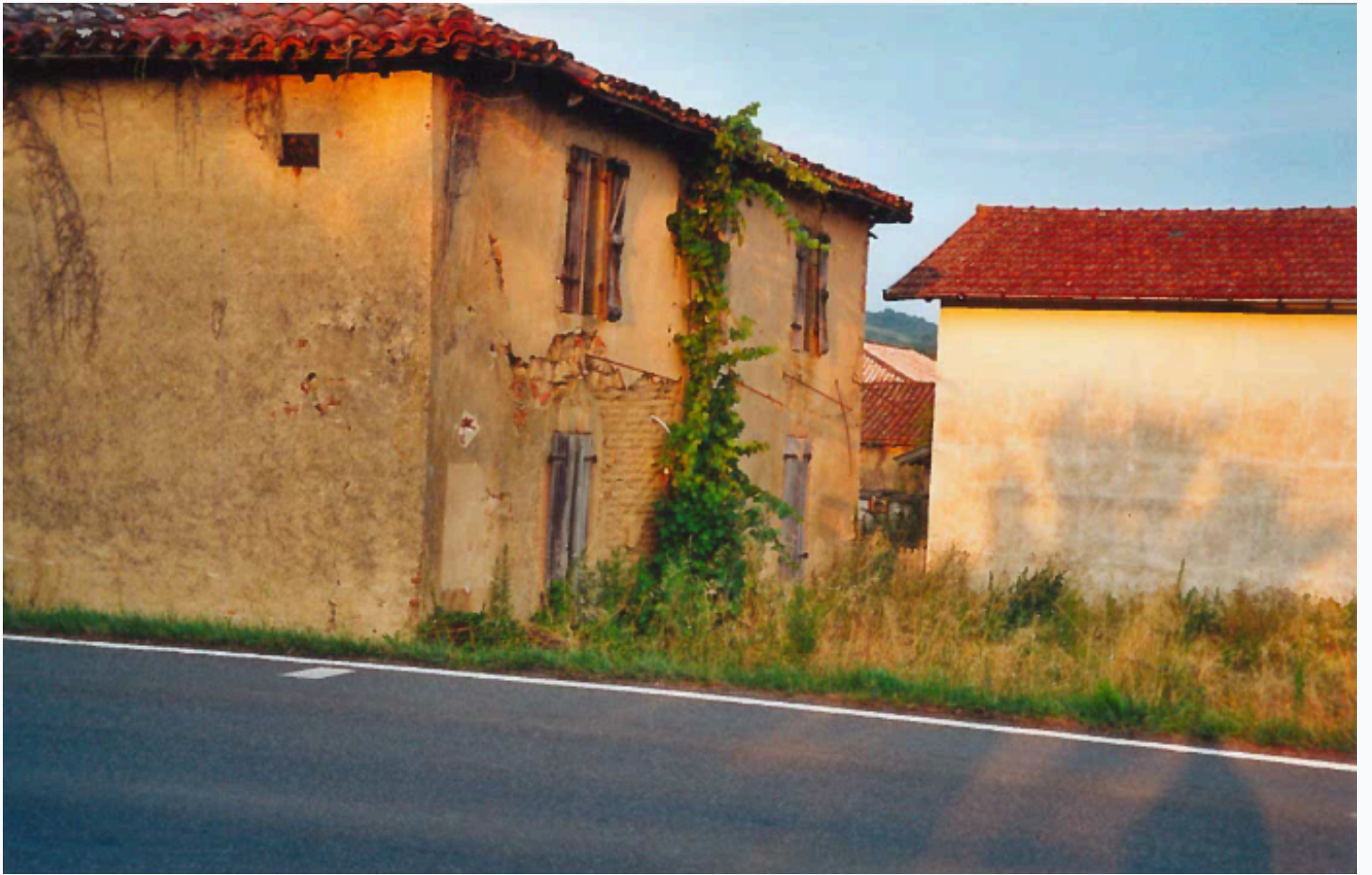
Ancienne maison de Beauville