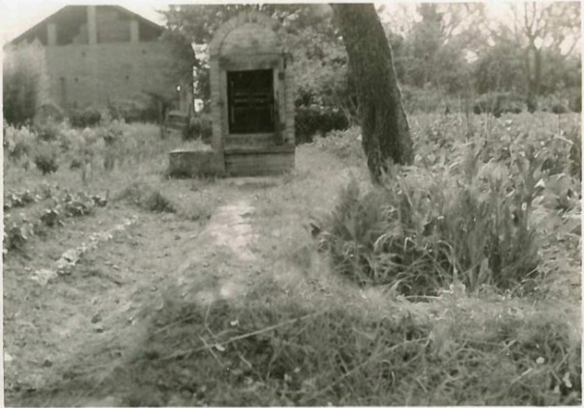
Puits sur l'ancien terrain de la salle des fêtes